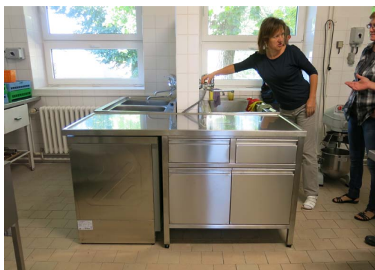
Nové vybavení školní kuchyně

Poslední zásadní dokončenou akcí je nová odborná učebna zaměřená na výuku jazyků a počítačů pro naše děti. Celková hodnota výstavby učebny byla 1.9 mil. korun. Naší obci se podařilo získat dotaci v rámci regi-