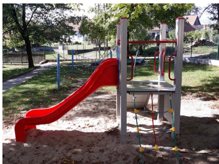
Atrakce pro děti