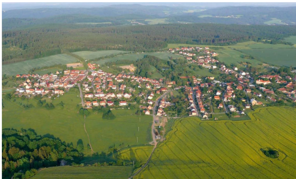
Letecký pohled na Rudici 2017

V tomto zpravodaji je obsažen seznam proběhlých hlavních investičních akcí a událostí v obci Rudice v posledních čtyřech letech. Zastupitelstvo obce plánuje obnovit pravidelné vydávání zpravodaje, a to s půlroční frekvencí.