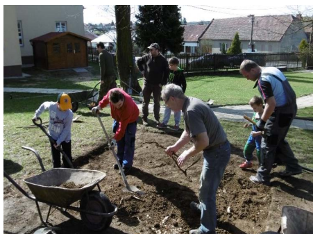
Terénní úpravy pro usazení dětské atrakce