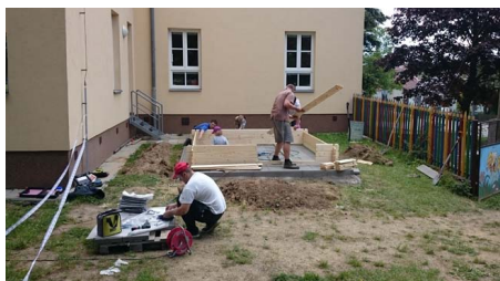
Příprava stavebního místa