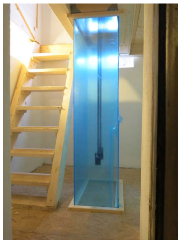
Přístup do věže

onální podpory přes Místní akční skupinu (MAS Moravský kras) ve výši 95% na zřízení této speciální moderní učebny. Moderní vybavení učebny jako je interaktivní tabule, mobilní počítače, katedra atd. tak zkvalitní výuku žáků. Navíc kompletní stavební úpravy navýší kapacitu počtu žáků ve škole. Podmínkou získání této dotace byla i bezbariérová úprava WC v 1NP a pořízení tzv. schodolezu pro dopravení případného vozíčkáře do každé výškové úrovně naší školy. Jelikož projekt