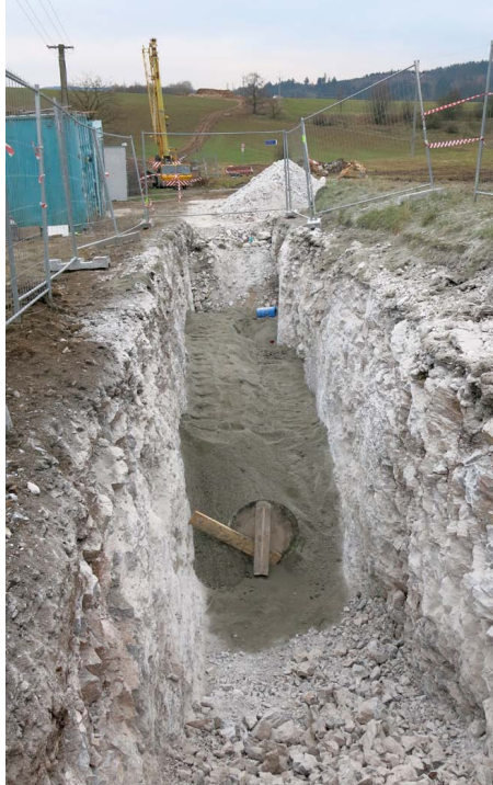
Kanalizace v Rudici

do ČOV Jedovnicích, 3 společné přečerpávací stanice a dvě lokální u RD. Na splaškový kanalizační systém bylo přepojeno na 170 nemovitostí.