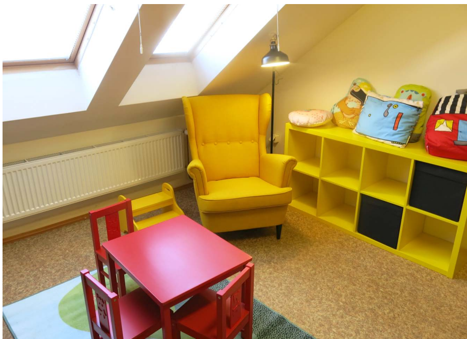
Nová čtenářská místnost pro rodiče s dětmi

rá pořádá výstavy, dílničky pro děti, ale například i předvánoční jarmark či pořádáním mezinárodního Josefského koštování vína společně s naší partnerskou obcí Fallbach z Rakouska.