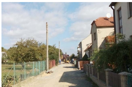
Betonové sloupce jsou zde již minulostí

K vedení nízkého napětí se podařilo připojit i vedení veřejného osvětlení (v obou stavbách cca 10 km kabelů pro každou stavební akci) a instalovat nové sloupce s osvětlením (100 sloupů), které jsou účinnější a přitom