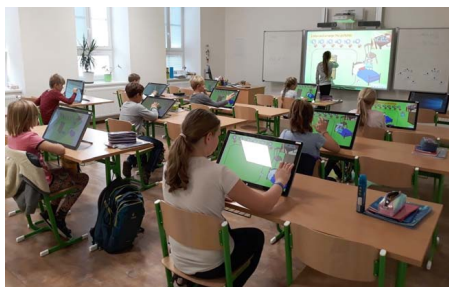
Nová počítačová učebna v provozu