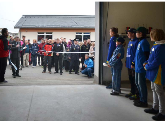
Slavnostní otevření zbrojnice JSDH Rudice a SZS

posoudit stavebně technický stav nosných konstrukcí včetně prostorové stability. Na základě stavebního posudku ze dne 20.6.2016 byl stavebně technický stav nosných konstrukcí označen za nevyhovující, v některých