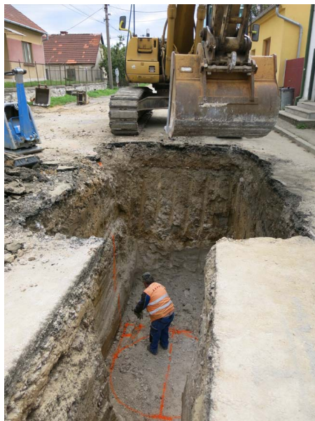
Kanalizace v Rudici

Vodárenská a.s. připravuje rozsáhlou stavbu propojení skupinových vodovodů obcí Svazku VaK Boskovice. V první etapě dojde k propojení Rudice a Klepačova a dále Lažánek, kdy vodovod bude sloužit pouze v případě havárie. Rudice, i přes to, že bude v centru propojení, o vodu nepřijde, neboť zde budou vybudovány dva vodojemy 2x 150m 3 ; jeden pro Rudici, druhý jako "přepouštěcí". Mezi nimi bude uzavírací ventil, který bude možno použít pouze v případě havárie. V rámci stavby kanalizace bylo vyměno či opraveno téměř 2,7 km nového vodovodu (z toho 1,4 km nového vodovodního přiváděče z Jedovnic) a vyměněno cca 73 vodovodních přípojek a odbočení.