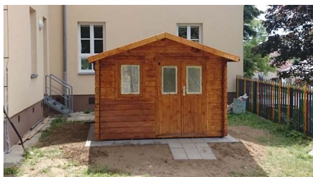
Nový domeček na hračky