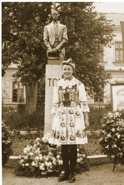
TGM v roce 1945

s odhalením nové sochy Tomáše Garrigue Masaryka v sobotu 27. října 2018 od 14 hodin před budovou i v budově Základní školy a mateřské školy Hugo Šaňky v Rudici. Zároveň bude otevřena výstava "Rudice 1918-2018" a "Druhý život T.G.M" v Rudické galerii v Dělnickém domě v Rudici.