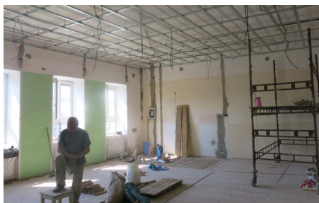
Počítačová učebna před úpravou

Na jaře 2018 proběhla výměna nevyhovující atrakce na školní zahradě. Stará byla odstraněna a proběhla příprava podkladu pro atrakci novou. Na přípravě prostoru se opět podílela spousta rudických rodičů. Vlastní prolézačku stavěla již profesionální firma z důvodu certifikací a bezpečnosti dětí.