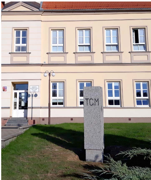
TGM příprava slavnostního znovuodhalení září 2018