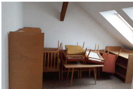
Původní prostor určený k rekonstrukci

Obec se výrazně podílí i na kulturním životě v obci a to nejen podporou svých spolků, které organizují např. Pálení čarodějnic-SDH, Vatra osvobození - SDH společně s obcí, Antonínské hody, Pohádkový les - Rudická chasa-mládež, Pochod z Rudického propadání, Běh kolem Klostermannovy studánky - TJ Sokol a mnoho dalších, ale i zabezpečením chodu např. místní knihovny, kterou v minulém roce obec vybavila novou technikou a vybudovala novou čtenářskou místnost zaměřenou především na rodiče s dětmi. Podílí se i na bohatém programu Rudické galerie, kte-